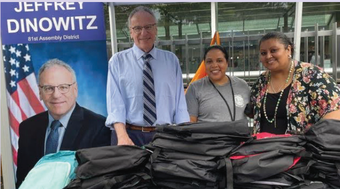
Assemblyman Dinowitz is pictured above with staff from Kingsbridge Library helping distribute backpacks outside of the Kingsbridge Library this fall.

PRSRT STD. US Postage PAID Albany, NY Permit No. 75