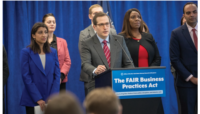
Acompañado por la Fiscal General Letitia James en apoyo a nuestro proyecto de ley sobre la mala conducta corporativa y protecciones al consumidor

Me enfoqué implacablemente en la Ley para Fomentar la Asequibilidad e Integridad Mediante Prácticas Empresariales Justas (FAIR, por sus siglas en inglés). Este proyecto de ley, que presenté en colaboración con la Fiscal General Letitia James, responde al cierre de la Oficina de Protección Fiscal al Consumidor por parte de la administración de Trump. Amplía la autoridad