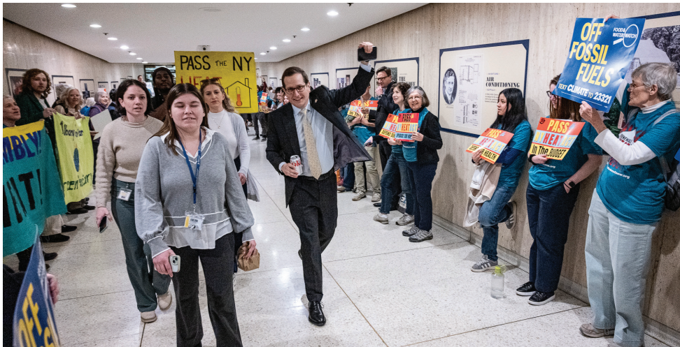
Unidos en una manifestación junto a activistas ambientales en Albany.

P.S. Como siempre, favor de comunicarse conmigo llamando al 212-866-3970 o enviando un correo electrónico a lasherm@nyassembly.gov si le puedo ayudar con cualquier asunto.